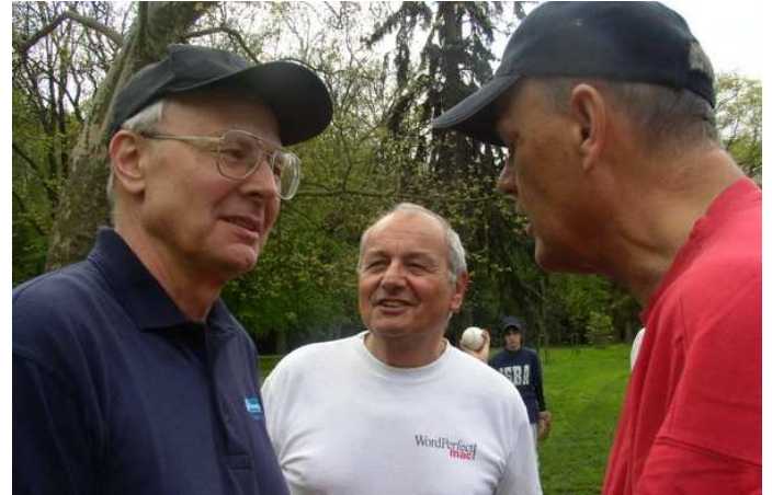
A po krátké strategické poradě....