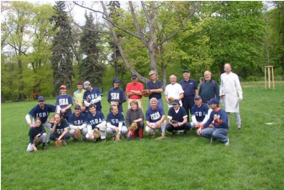
Obě mužstva po utkání.