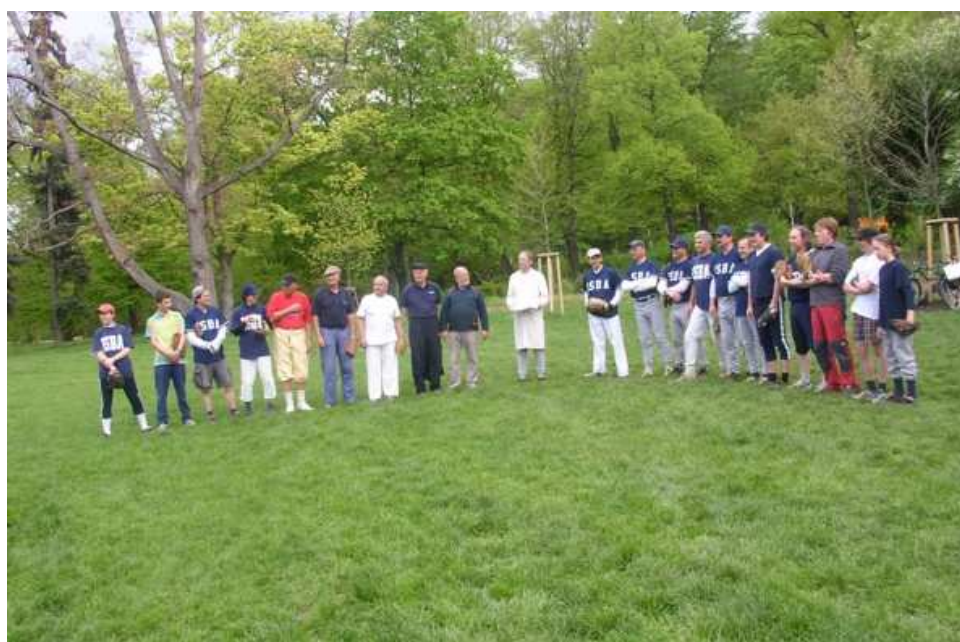
Obě mužstva: posílené „Trosky“ vs. ISBA před utkáním.