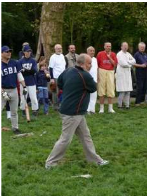
Výkony playerů „Trosek“ jak na hřišti....