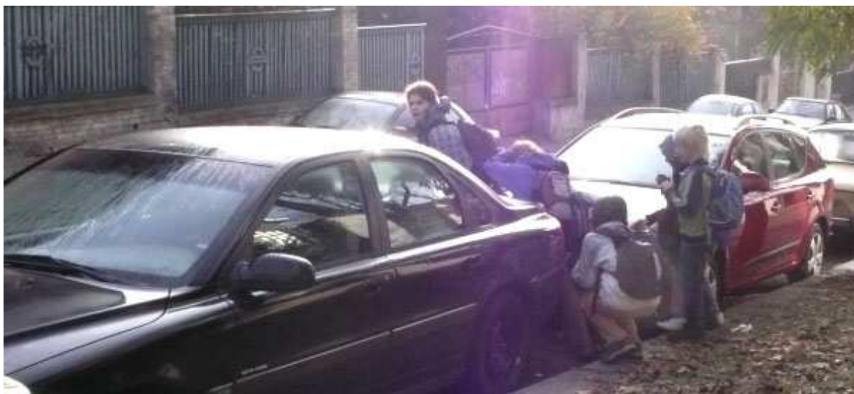
Pátrací tým postupoval velmi obezřetně, takže k žádným ztrátám na životech, ani ke zranění nedošlo