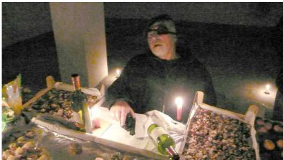
Mafián znavený po výslechu a střežící zmučeného Vopršálka netušil, že za chvíli bude ležet bradou vzhůru.