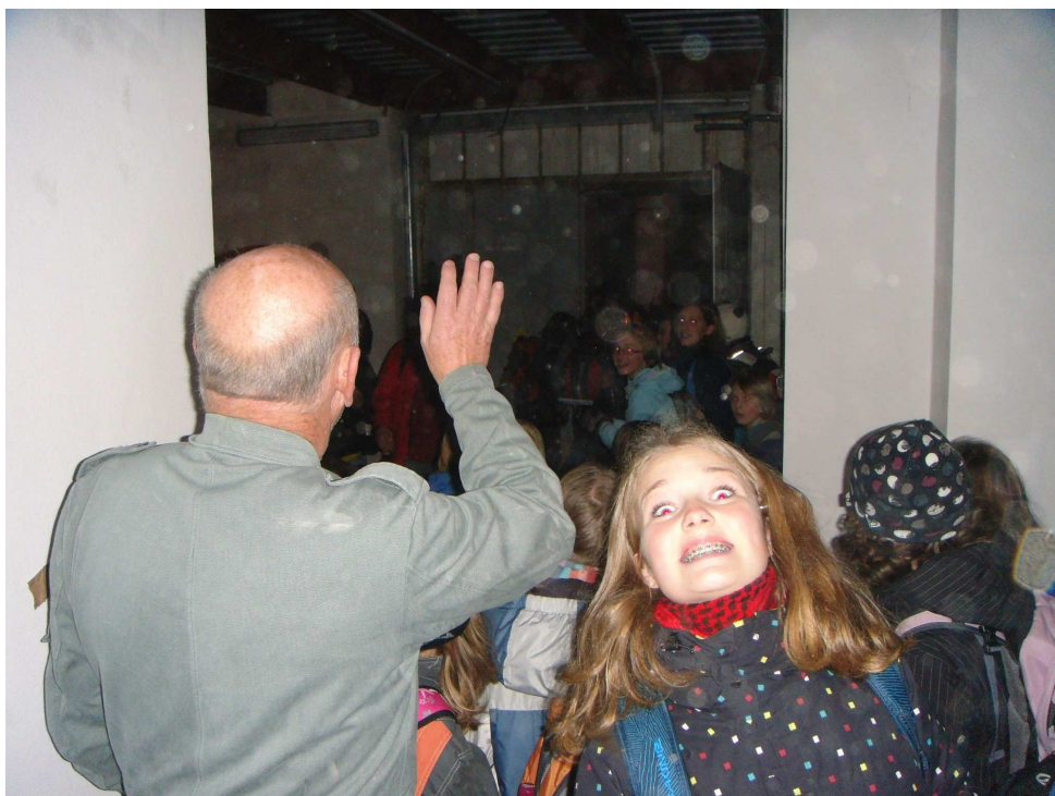
Mafie začala střelbu do skautů, kteří v úděsu a velkého jekotu se snaží uprchnout, ale proradný doubleagent kapitán Giovanni Delacroce je zastavuje, takže nakonec skauti na mafii zaútočili a zlikvidovali ji.