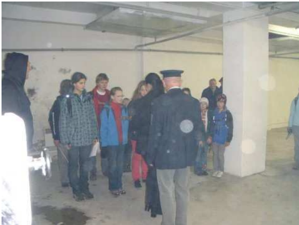
Posádce hrdinného Pátého oddílu vodních skautů jsou udíleny medaile za vynikající službu Česko-Moravské policii při likvidaci mafie