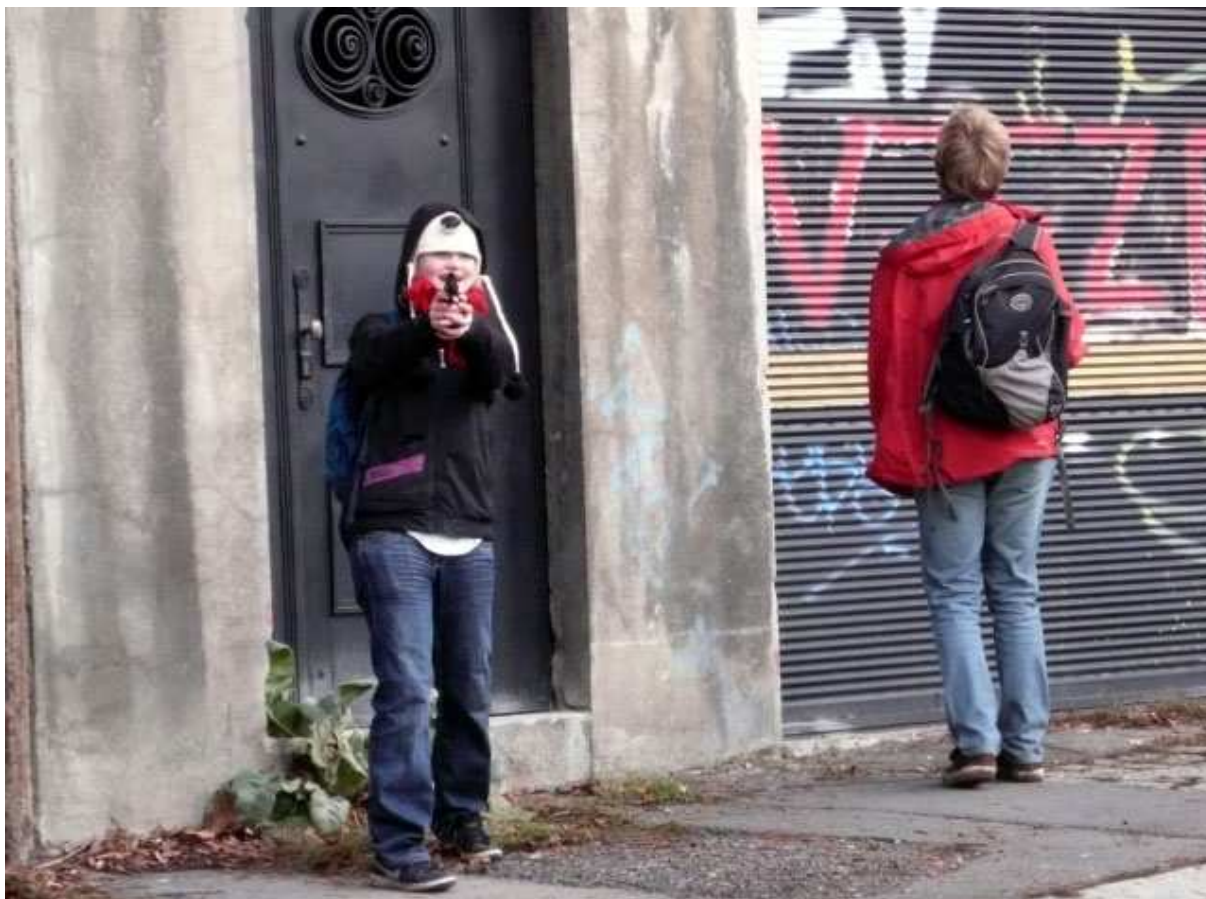
I ty nejmladší plavčice statečně člena mafie odrážely střelbou