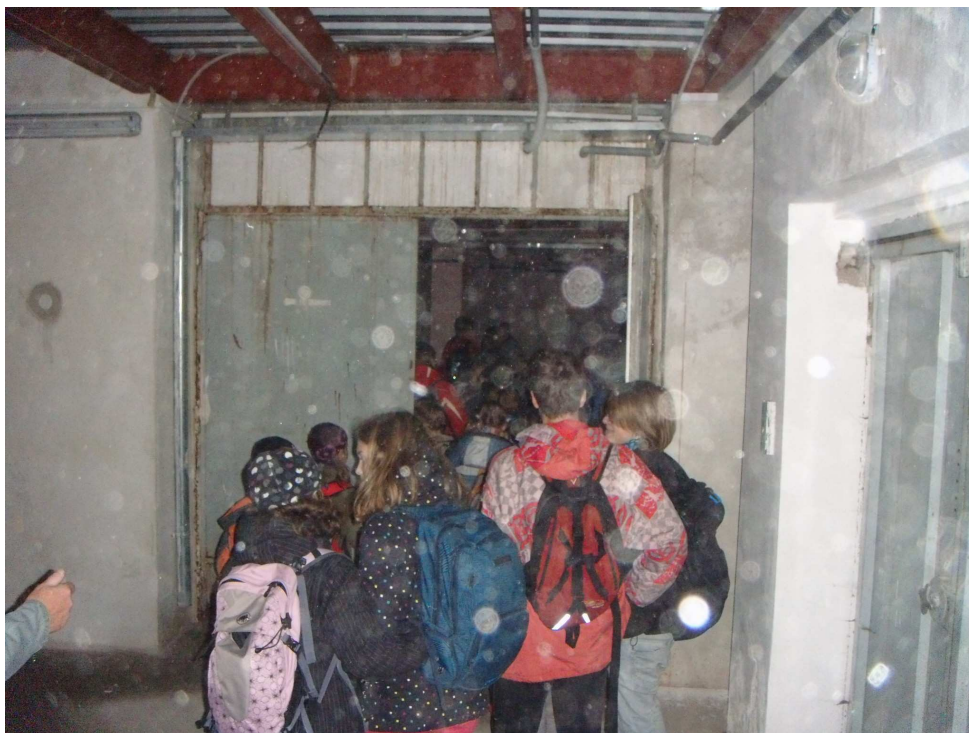
Oddíl vstupuje do podzemního bunkru mafie