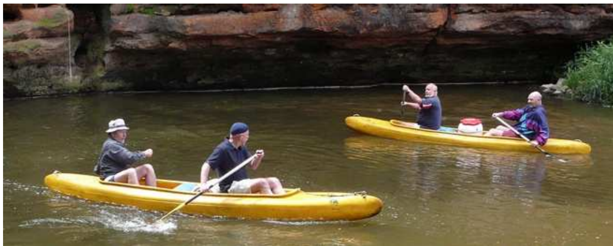
Tak to začalo – zatím vesele...