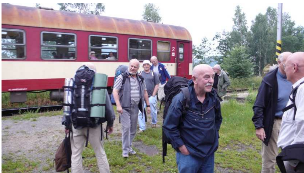
Začali jsme vesele výstupem na zastávce Velký Grunov