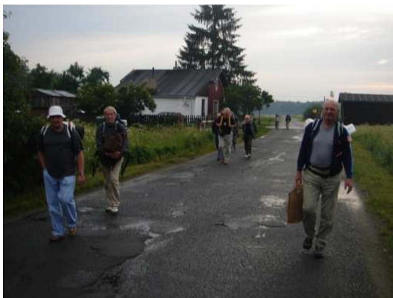
Cesta z Velkého Grunova do Novin pod Ralskem