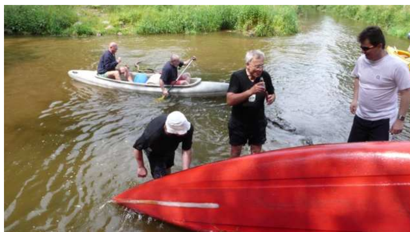
I cizí vodáci nám začali pomáhat.