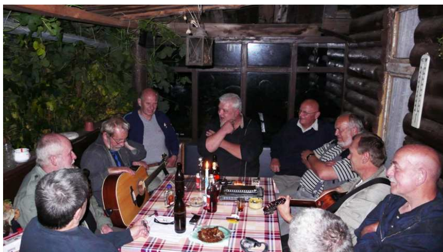
Při kytáře u Ládi a jeho kamaráda na chatě v Novinách