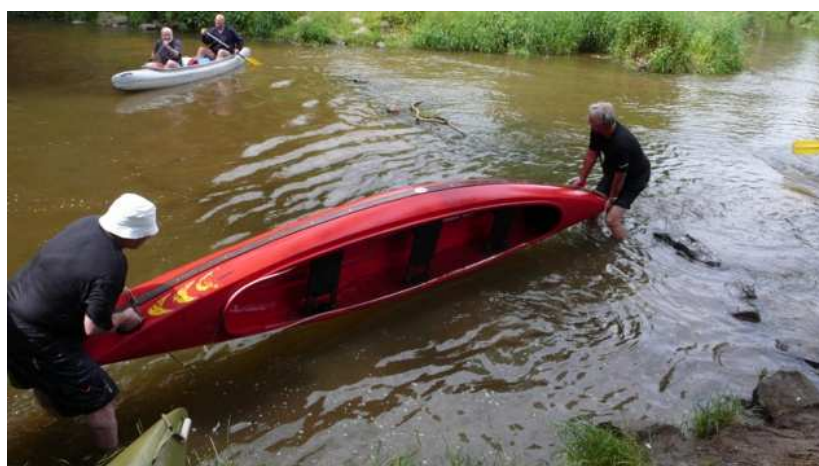
posléze některým tvrdnou rysy. Cacidlo s Kájou se ještě smějí.