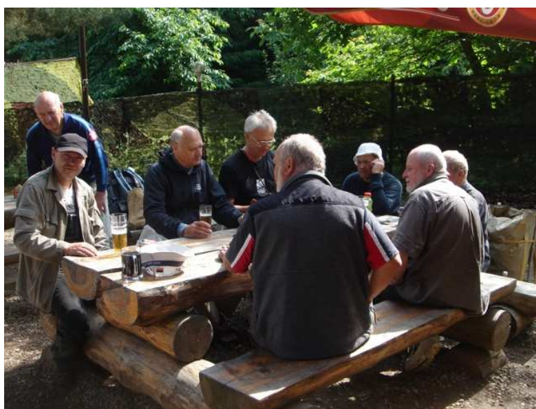
V kiosku na počátku plavby