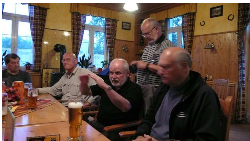
V hospodě v Novinách