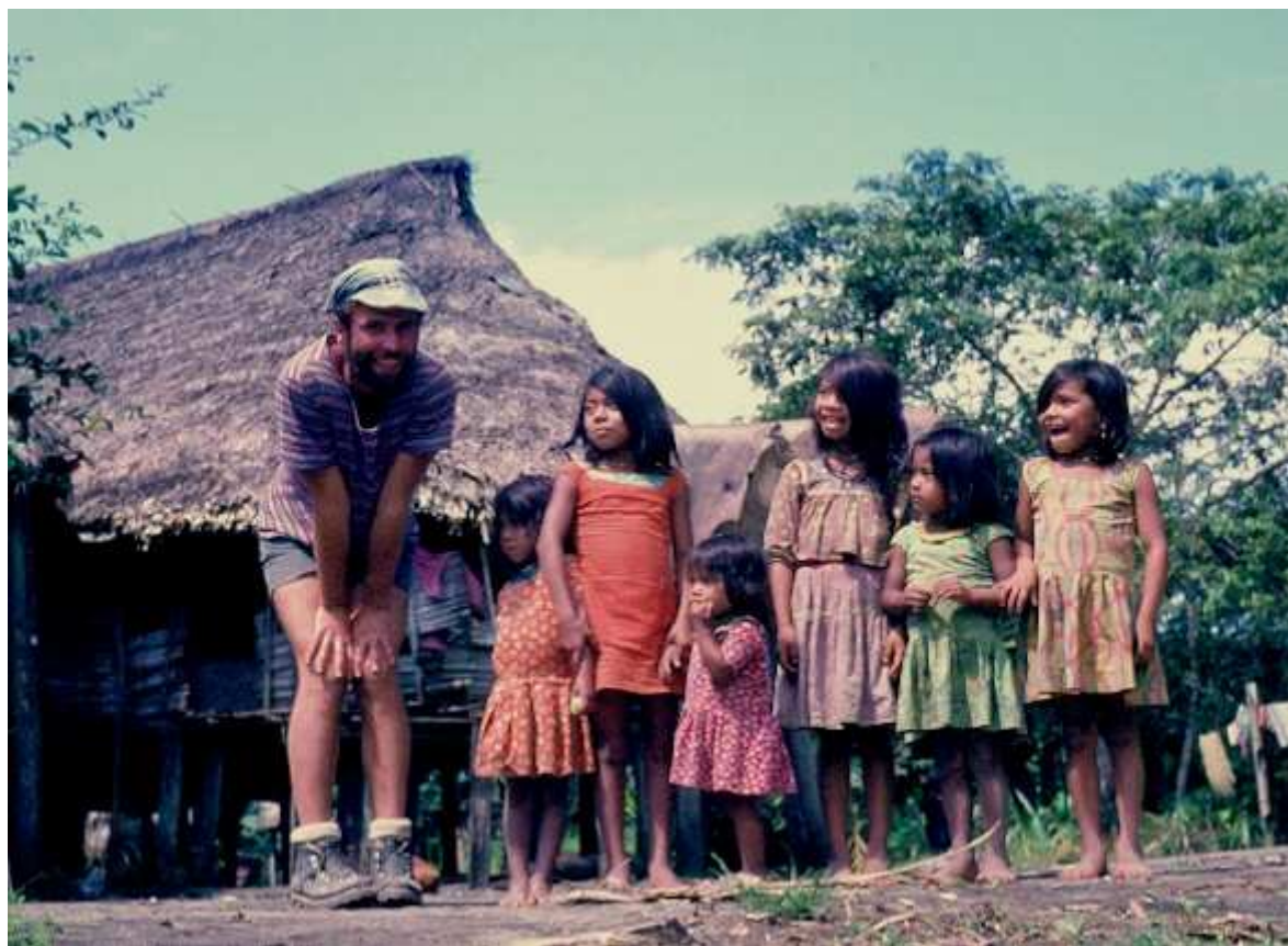
Louln zakládá dívčí oddíl Pětky v Amazonii. (Tedy já, bych mu svoje vnučky nesvěřil)