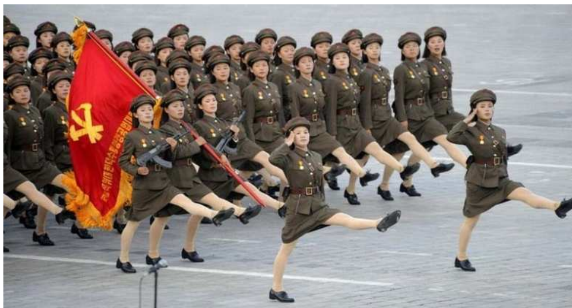
Trochu erotiky nikdy neuškodí. Není nad pohled na jemnou dívčí nožku. Zlatý komunismus.