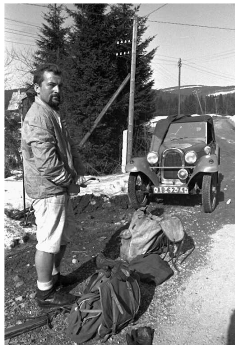
A takhle jsme v té době cestovali (1996). Ty tam byly cesty autostopem. Už jsme vlastnili vlastní vozy.