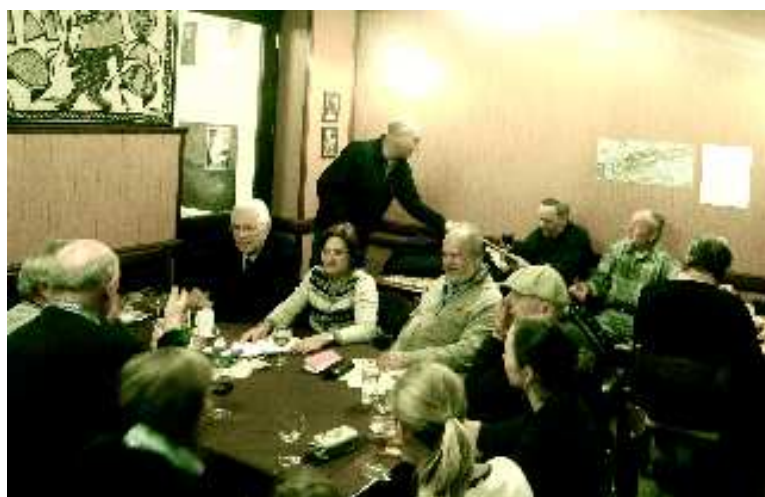
Debatu o programu oslav v neobvykle vážném tónu....

Na schůzce v březnu fotografoval Kačka :