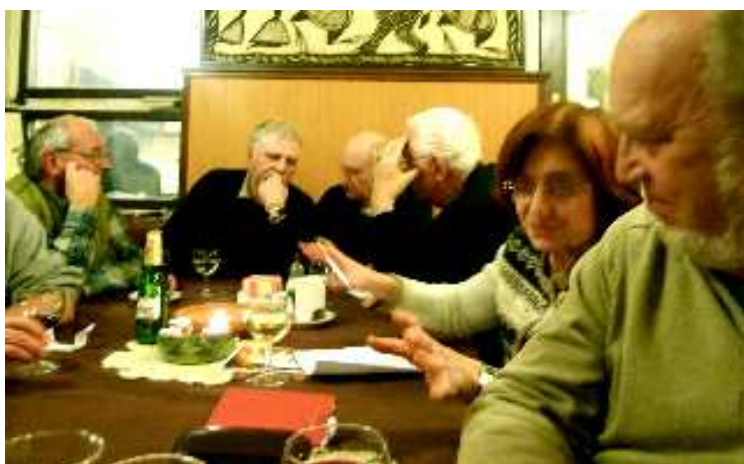
Takhle vážně jsme pracovali.