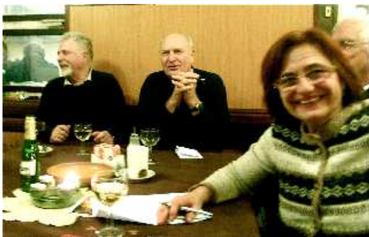
Dorka byla uvolněná a zřejmě spokojená přesto, že na ní spočívá celá tíže dnešního oddílu.