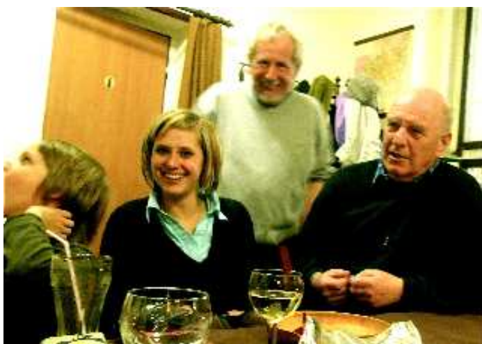
Aničku nezněrvóznil ani Pulec s Hakimem .