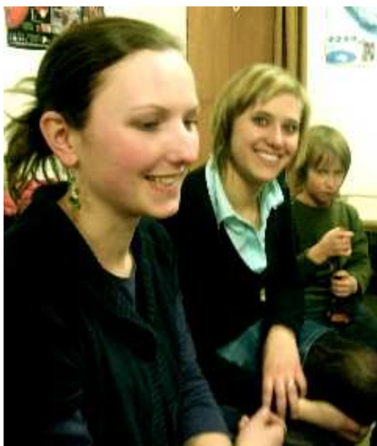
To co chybí Prvostředečnickům bylo výborně doplněno:...půvab a mládí.