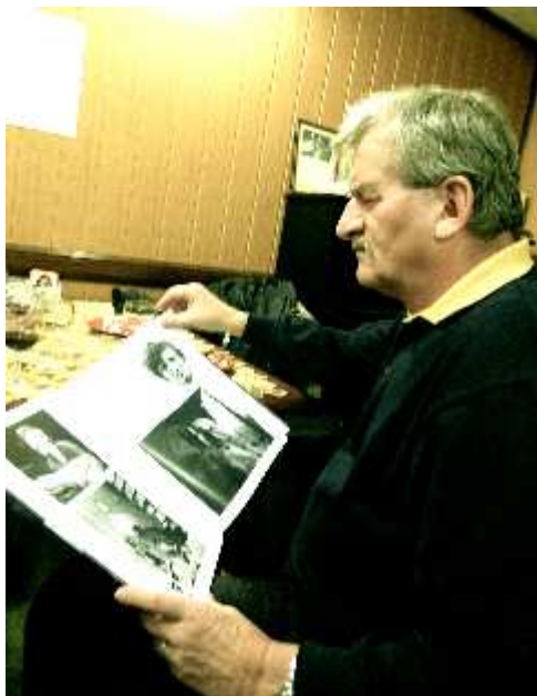
Morous Yško si prohlížel obrázky.