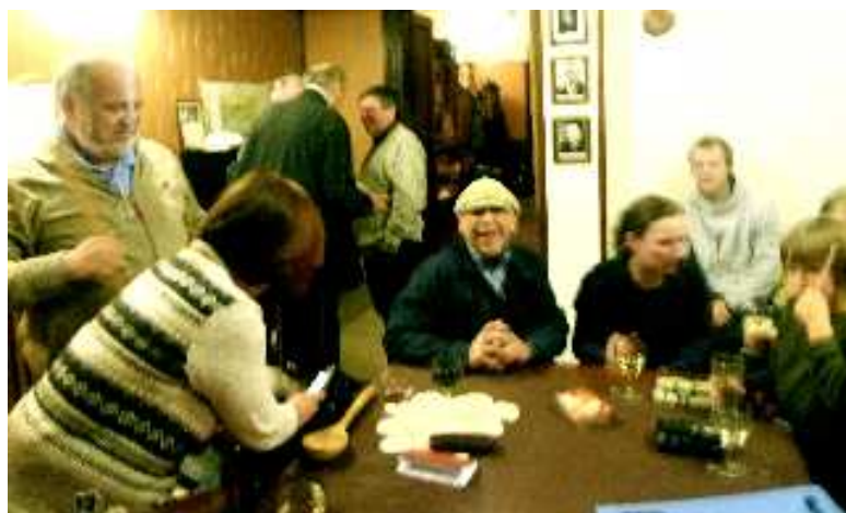
...ale i na obvyklou srandu došl.