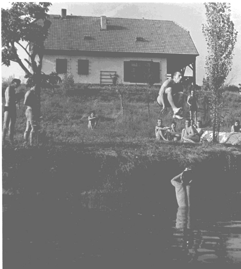
Županovice 1971 nebo 2 (?) zleva: stojící Logaritmus, ?, sedící Anton, Boja, Zdeněk, Kušnička, ?, Zub, Smeták, ve vzduchu Batul, přicházející Standa, fotografující Loulín a fotografii udělal Chingo. Až vzadu, kráčeující k domu, je Zdena.