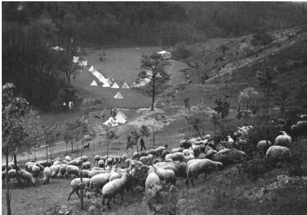
Výbrnice u Nižbora v třicátých letech (asi).

vždy třeba domluvit až před samotným termínem konání táboráku. A otázka termínu je zvláště důležitá. Hned v prvním roce konání „Nižbora“ se totiž dohodlo, že se tato akce bude konat vždy: „PRVNÍ SOBOTU PO DRUHÉ STŘEDĚ V ČERVNU!“ A toto pravidlo platí stále, i když si ho už mnozí nepamatují. Ahoj Reyp