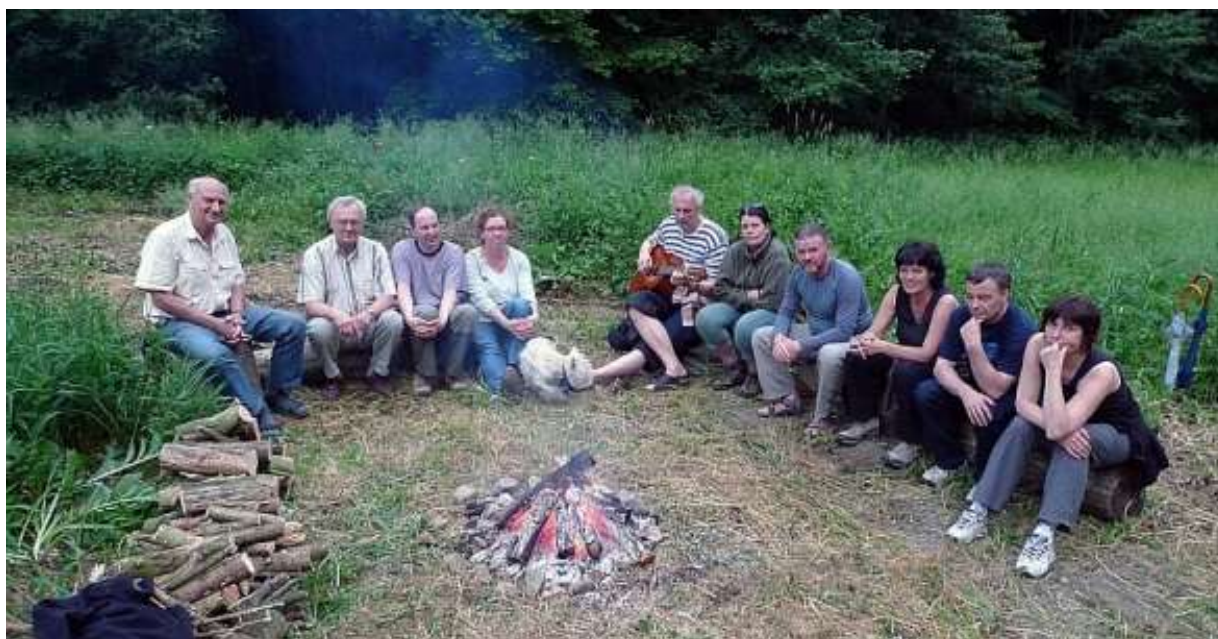
Výbrnice u Nižbora 2010.