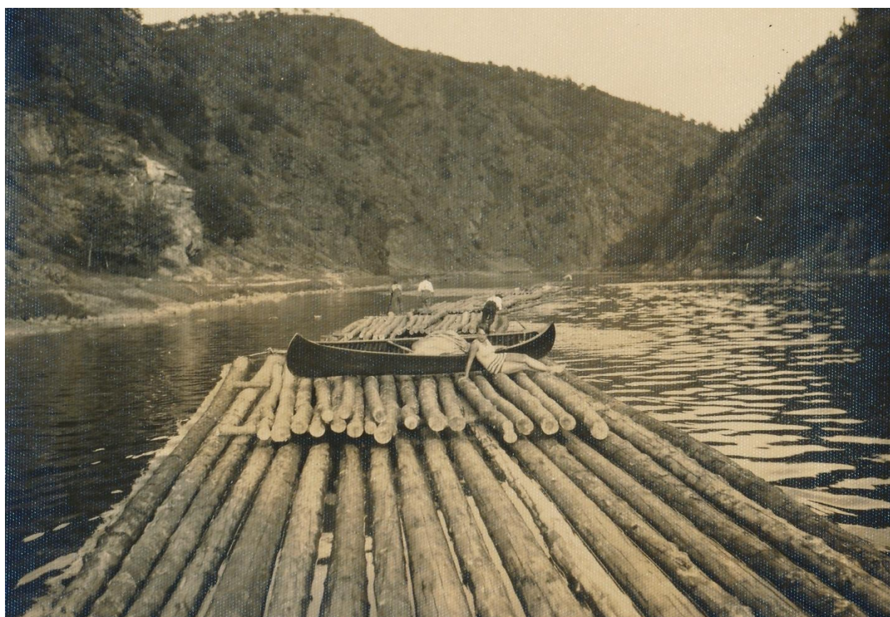
Jak to vypadalo nad Bukem v srpnu 1928