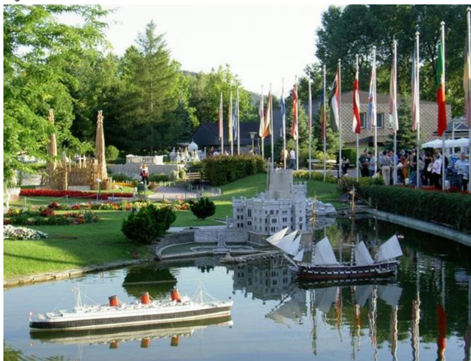
Model Queen Mary a fregaty Novara v parku Minimundus u rakouského městečka Klagenfurt